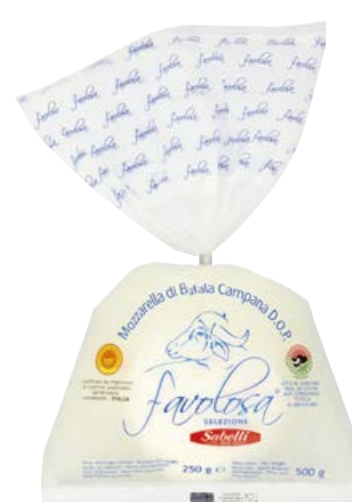
Mozzarella bufala campana dop "favolosa" SABELLI gr 250 (€ 9,96 al kg)