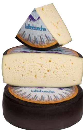
Formaggio Asiago dop fresco PENNA NERA (€ 10,90 al kg)