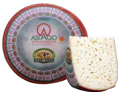
Formaggio Asiago dop fresco SAN ROCCO (€ 11,90 al kg)