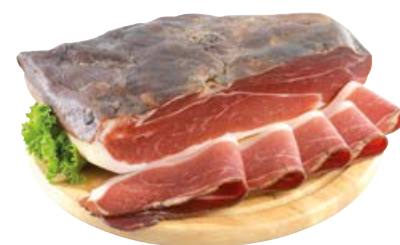
Speck SENFTER (€ 18,90 al kg)