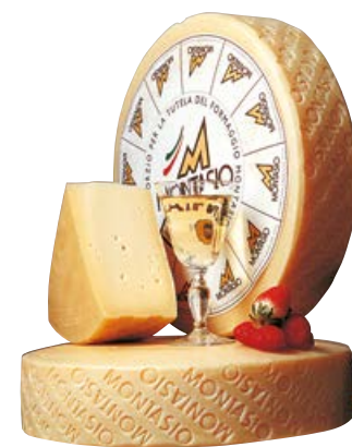
Formaggio MONTASIO dop fresco (€ 10,90 al kg)