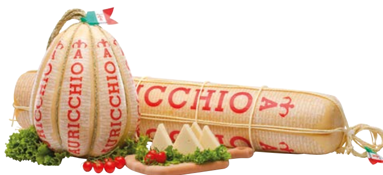
Formaggio provolone piccante AURICCHIO (€ 15,90 al kg)