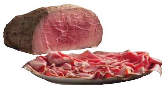
Roastbeef di fesa arrosto (€ 29,90 al kg)