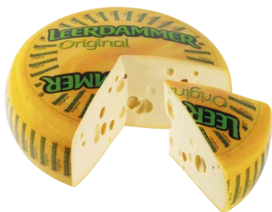
Formaggio LEERDAMMER (€ 10,90 al kg)