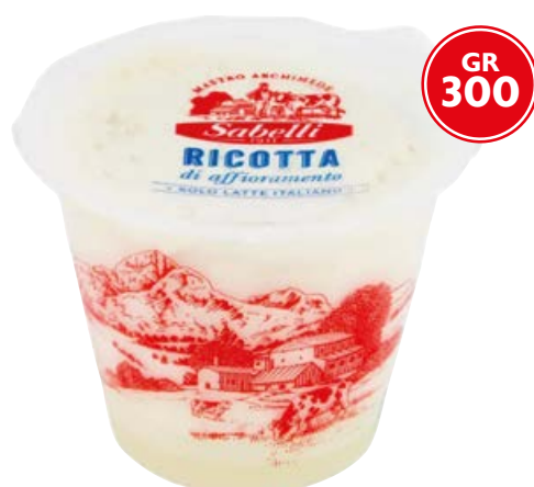
Ricotta take-away SABELLI gr 300 (€ 5,30 al kg)