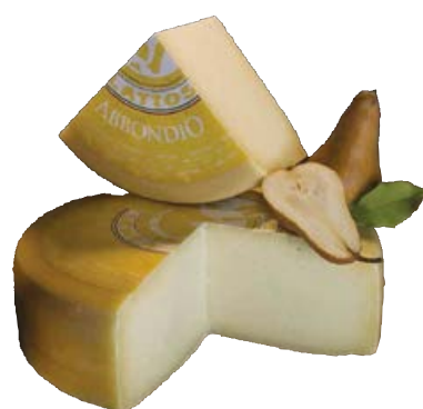
Formaggio senza lattosio ABBONDIO (€ 13,90 al kg)