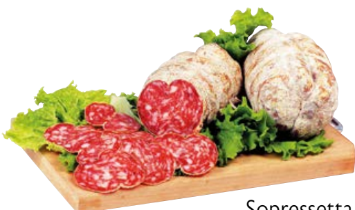
Sopressetta di collina nostrana con/senza aglio (€ 16,90 al kg)