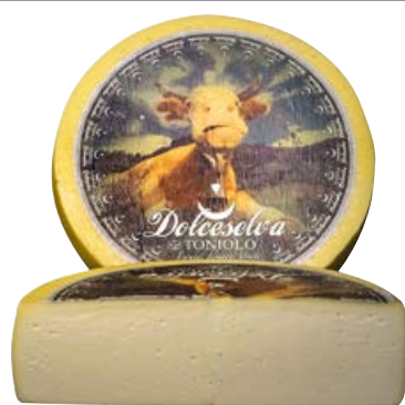
Formaggio latteria DOLCE SELVA (€ 9,90 al kg)