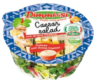
Piatto unico Caesar Salad DIMMIDISI gr 135 (€ 22,15 al kg)