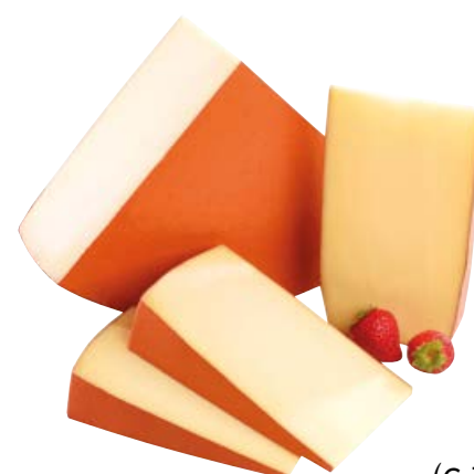
Fontal Alpinella (€ 7,90 al kg)