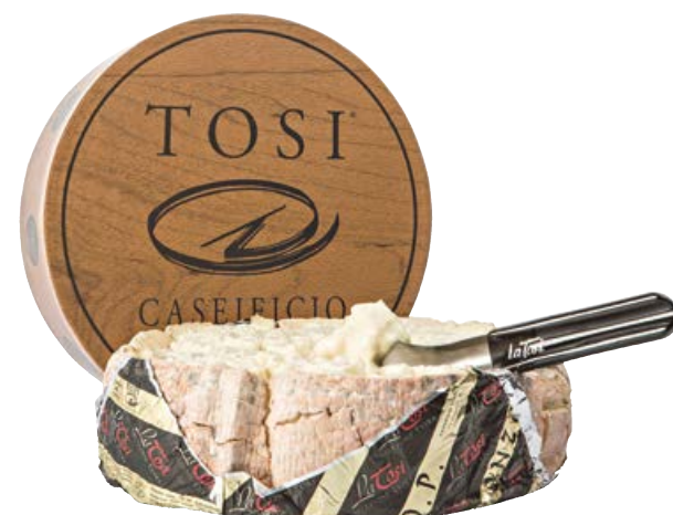
Gorgonzola dop al cucchiaio TOSI (€ 17,90 al kg)