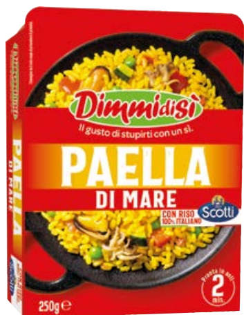
Paella di mare DIMMIDISI gr 250 (€ 11,96 al kg)