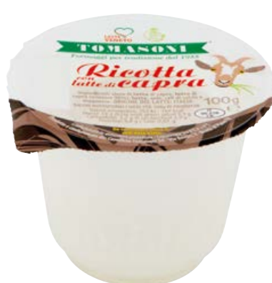
Ricotta con latte di capra TOMASONI gr 100 (€ 14,90 al kg)