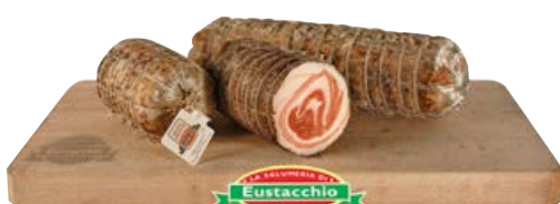
Pancetta arrotolata veneta (€ 16,90 al kg)