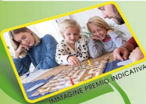
IMMAGINE PREMIO INDICATIVA

PRESIDI MEDICO CHIRURGICI reg. n°21274, 20259. Leggere attentamente le avvertenze o le istruzioni per l'uso. Autorizzazione ministeriale del 16/02/2026