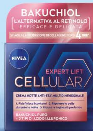
Visage crema cellular anti-age notte ml 50 (€ 218,00 al lt)