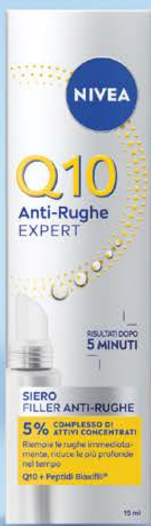
Crema anti rughe q10 filler mirato visage ml 15 (€ 726,67 al lt)