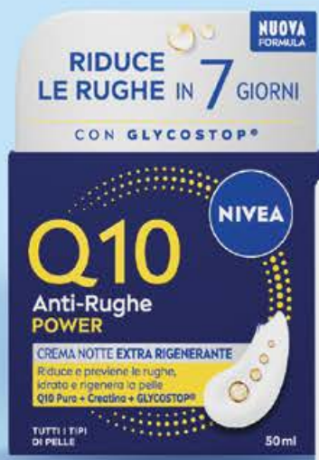
Crema viso power q10 notte visage ml 50 (€ 179,80 al lt)