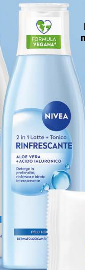
Latte + tonico 2 in 1 ml 200 (€ 16,45 al lt)