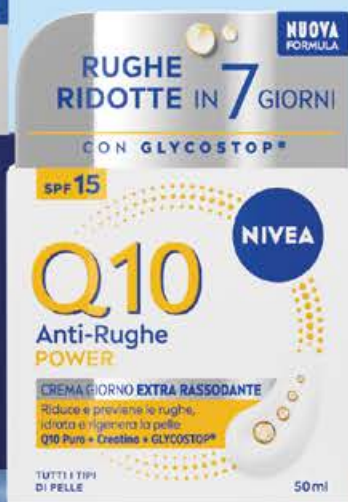
Crema viso power q10 giorno visage ml 50 (€ 179,80 al lt)