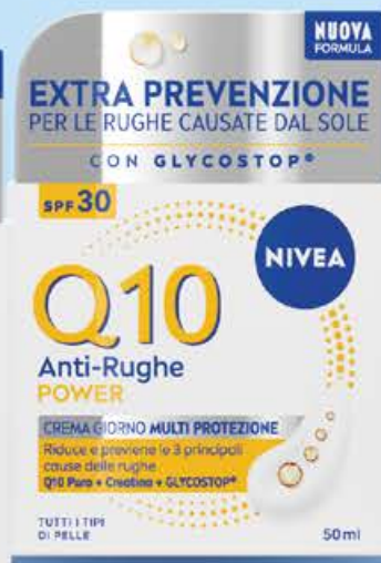
Visage q10 power crema giorno fp30 ml 50 (€ 196,00 al lt)