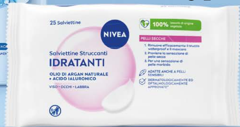
Salviette struccanti pelli normali/pelli secche/sensibili x25