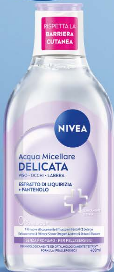
Acqua micellare sensitive extra delicata ml 400 (€ 7,98 al lt)