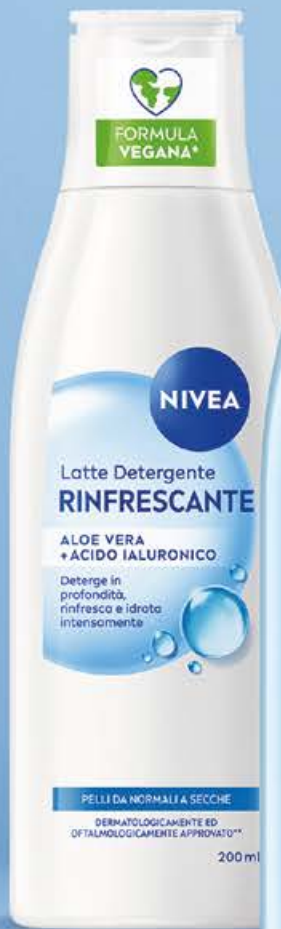
Latte detergente ml 200 (€ 16,45 al lt)