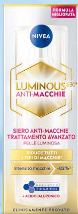
Luminous antimacchie siero trattamento avanzato visage ml 30 (€ 566,33 al lt)